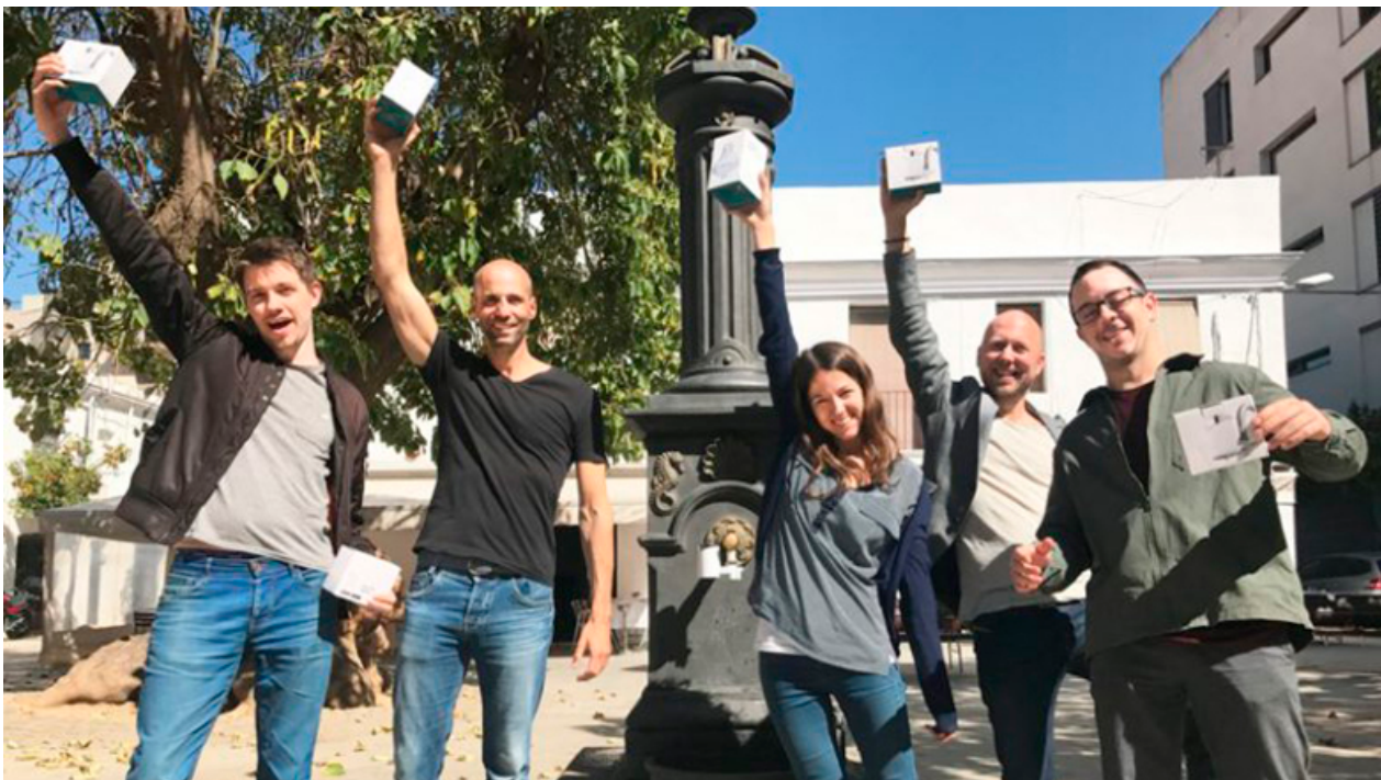
TAPP Water levanta 300.000€ en su primera ronda de financiación